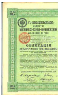
Deel van een aandeel in de Russische spoorwegen

‘Acht kinderen en daar was ik de jongste van. Daarvan ben ik met mijn 96 jaar alleen nog in leven. Ik ga al aardig mijn moeder achterna: die werd 100. Mijn vader was 72 toen hij stierf.’