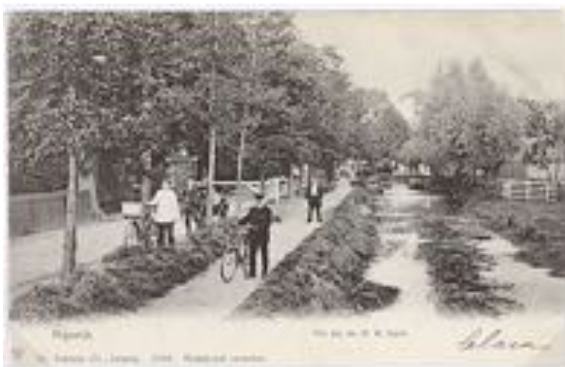
De tol aan de Van Vredenburgweg anno 1902