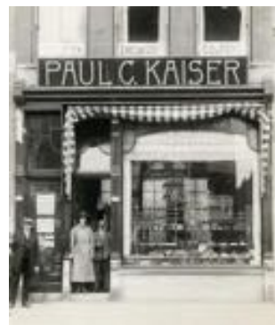
Eén van de winkels van Paul Kaiser in Den Haag

De chirurg moest ook een stuk onderarm boven de pols amputeren. Mijn vader bleek de 2 e persoon in Nederland te zijn die een uitkering kreeg ingevolge de Ongevalwet. Dat was één gulden en veertig cent per dag, behalve de zondag, want dan hoefde je niet te eten!’