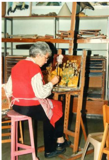
Actief in het atelier in 'De koepeltjes'

Waar werkt u meestal, in het atelier of hier thuis?